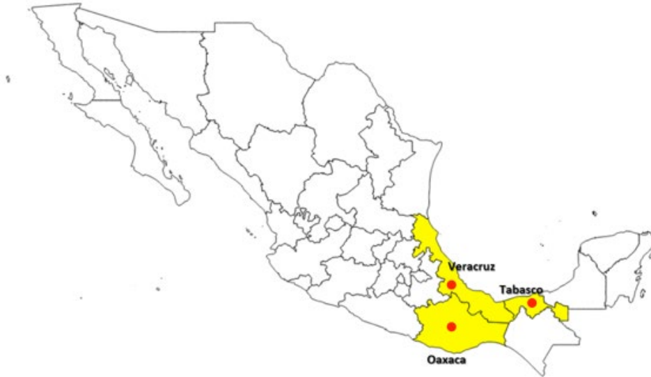
Figura 2. Distribución de Coniothyrium zuluense en México.

En el año 2003 se manifestaron infecciones severas en Eucalyptus grandis y E. urophylla , en Veracruz (FAO, 2007).